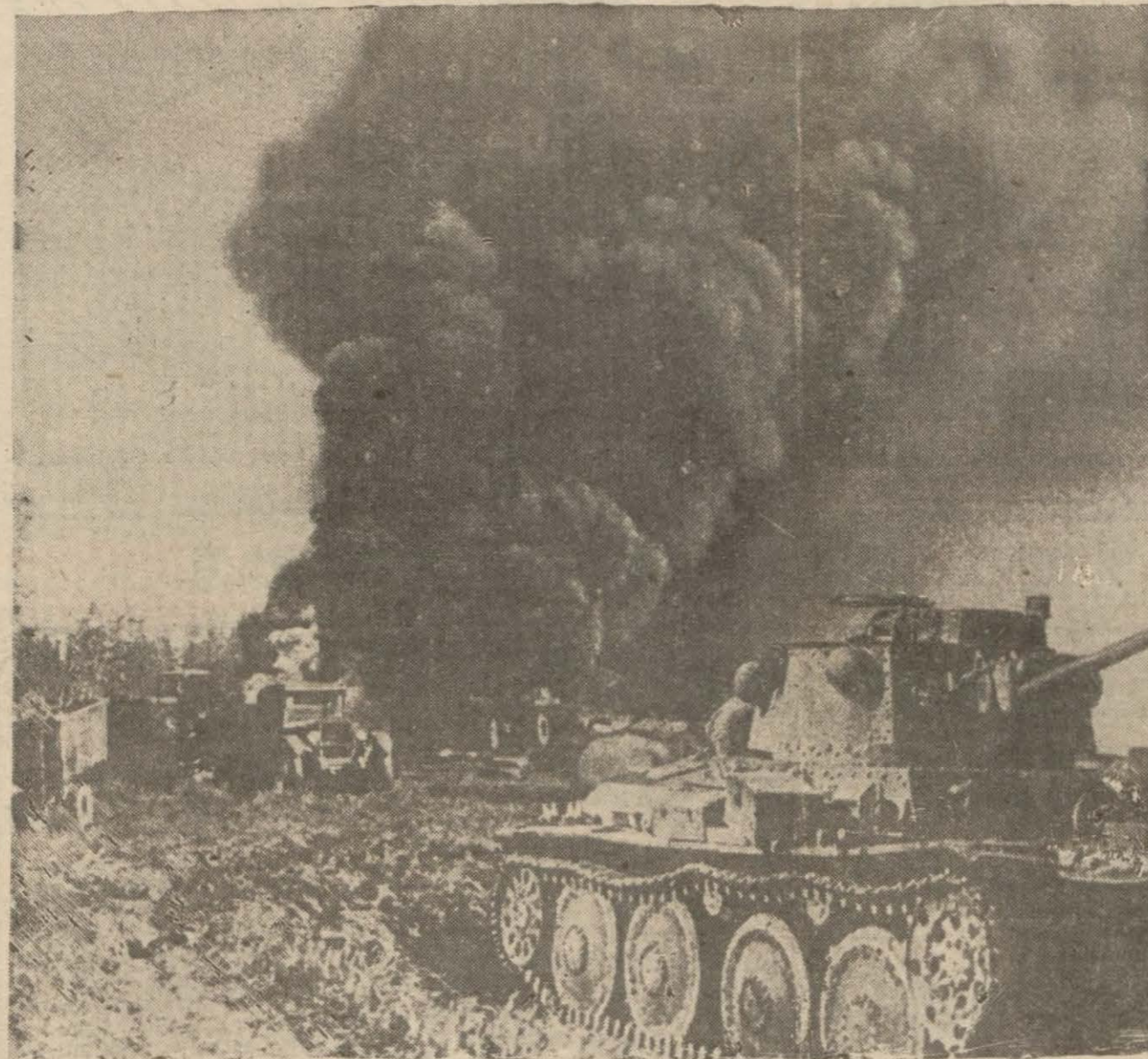
Şark cephesinde çelik fırtınası: Tanklar arasında muharebe

Welles Amerika hükümetinin arka bu hadiseye kapanmış nazarle bakacağını iddia etmiştir.